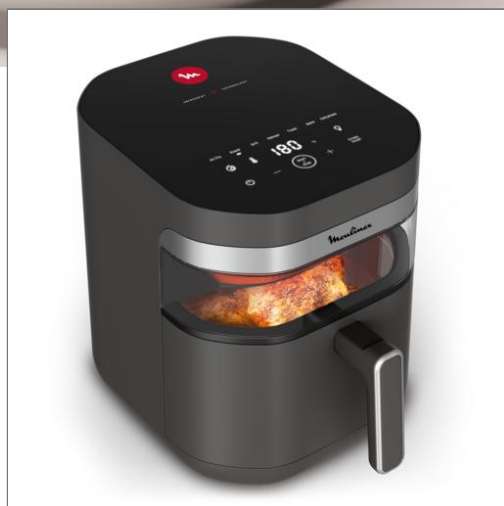
Easy Fry Infrared, Friggitrice ad Aria, Risultati Croccanti, Tecnologia Infrared Easy Fry Infrared EZ832HF0