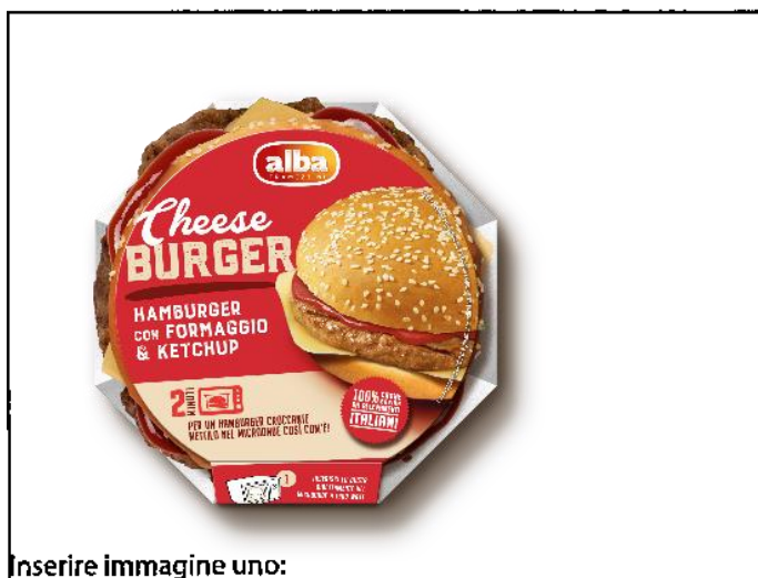
Inserire immagine uno:

Non consumare e restituire al punto vendita. Per ulteriori informazioni scrivere all'indirizzo e-mail: info@albratramezzini.it