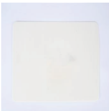
Tavola pizza Romana 25X35NEW (CODICE 901496)

Disclaimer: Verifica le disposizioni del tuo comune per la gestione dei rifiuti